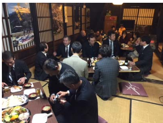
[懇親会にて住民の絆を深める]