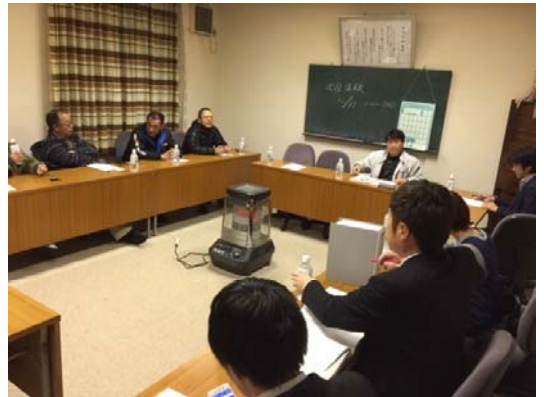
【荻町の交通状況について意見交流】