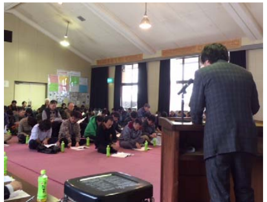
【大寄合にて中間活動報告】