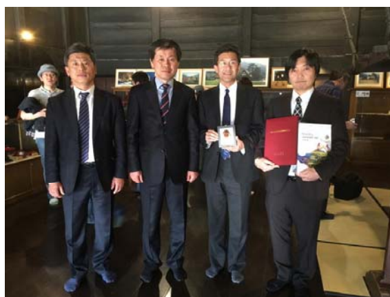
【安東市議長・副議長と会長・副会長】