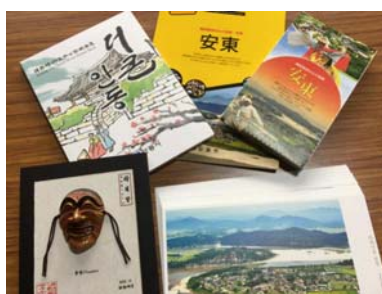
【安東市よりのお土産】

なお、荻町公民館ロビーには、平成23年の交流でいただいた河回里の写真と仮面を展示しています。今回いただきました仮面や絵はがき、観光ガイド（日本語）類も、住民の皆様にご覧いただけるように展示いたします。また、今後の交流にむけてのご意見も、ぜひ委員・役員にお寄せくださいますようお願い申し上げます。【文責：和田・今藤】