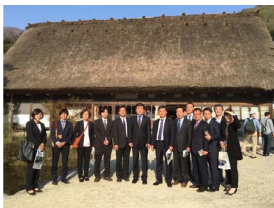
【ご一行の皆様と記念写真】